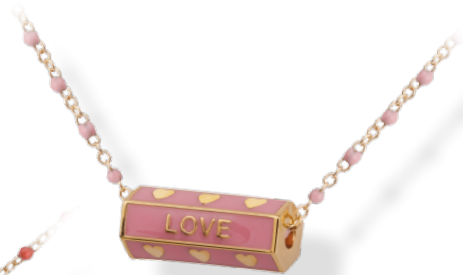
▲ Collier 43cm Prisme hexagonal émaillé rose «LOVE» 3208726