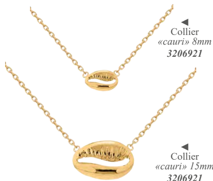
Collier «cauri» 8mm 3206921