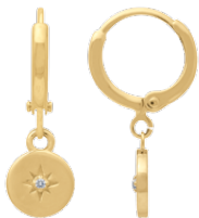
▲ Mini-créole pendante - zirconium «Étoile solitaire» 1208510