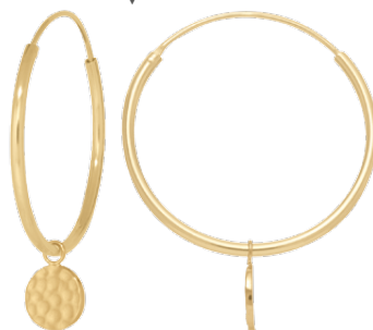
existe en Ø12mm et Ø20mm