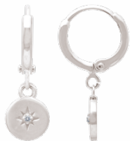
▲ Mini-créoles pendantes «étoile du Berger» zirconiums 1908510