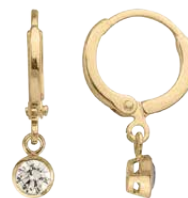
▶ Mini-créole pendante zirconium «aqua marine» serti clos 1208557AQ