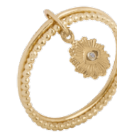
▲ Bague multi-fils pampille zirconium «Oeil Solaire» 5208517