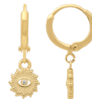
▲ Mini-créole pendante - zirconium «Oeil Solaire» 1208517