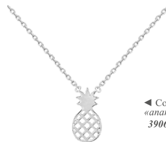
◀ Collier «ananas» 3906360