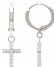
▲ Mini-créoles pendantes «Croix» zirconiums 1908511