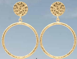
▲ Boucles d'oreilles pendantes «cercles martelés» 1207358