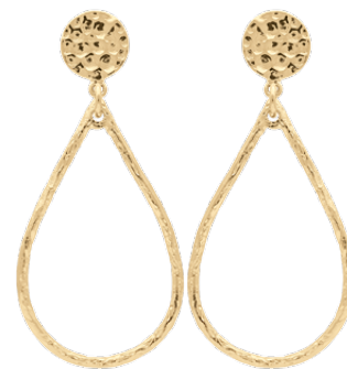
▲ Boucles d'oreilles pendantes forme goutte «cercles martelés» 1207359