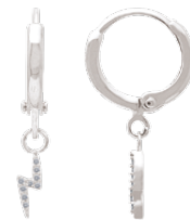
▲ Mini-creoles pendantes «éclairs» zirconiums 1908513