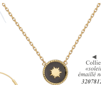
▲ Collier «soleil, émaillé noir» 3207812N