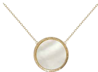
▲ Collier «nacre, cercle martelé» 3207638.MOP