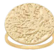
▲ Bague «Pastille froissée» diam pastille: 20mm 5208544