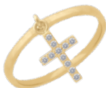
▲ Bague pampille - zirconiums «Croix» 5208511