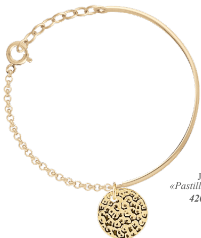
▲ Jonc «Pastille froissée» 4207288