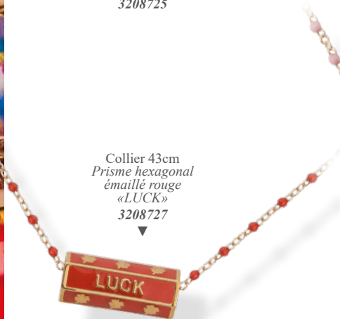
▲ Collier 43cm Prisme hexagonal émaillé rouge «LUCK» 3208727