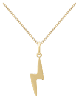
▲ Collier «éclair» 3208653