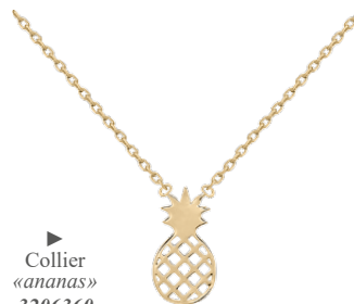
▶ Collier «ananas» 3206360