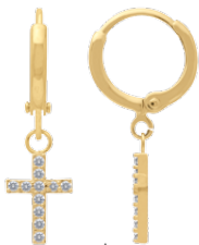
▲ Mini-créole pendante - zirconiums «Croix» 1208511