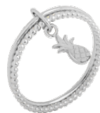
◀ Bague multi-fils pampille «ananas» 5907398