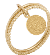
▲ Bague multi-fils pampille «Cercle effet froissé» 5208789