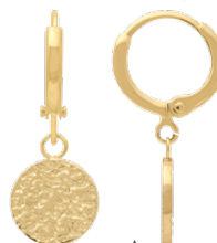
▲ Mini-créole pendante «Cercle effet froissé» 1208544