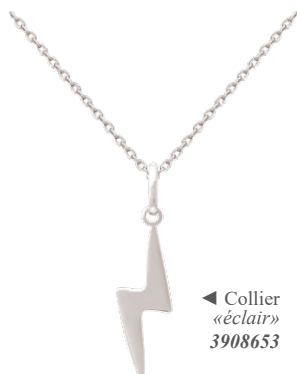
◀ Collier «éclair» 3908653