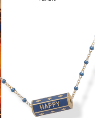
▲ Collier 43cm Prisme hexagonal émaillé bleu «HAPPY» 3208725