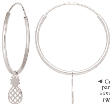
◀ Créoles pampille «ananas» 1908054