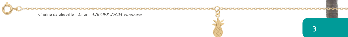
Chaîne de cheville - 25 cm 4207398-25CM «ananas»