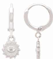
◀ Mini-créoles «œil solaire» zirconium 1908517