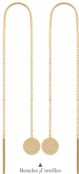
▲ Boucles d'oreilles pendantes «cercles martelés» 1208789-8MM