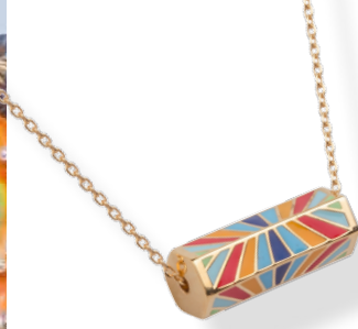
▲ Collier 43cm Prisme hexagonal émaillé «multicolore» 3208612