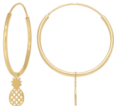
▲ Créoles «ananas» 1208054 existe en Ø20 et Ø30mm