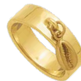
Bague pampille «cauri» 5208151