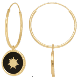
▲ Créoles 20mm pampilles «soleils, émaillés noirs» 1208056-20-N