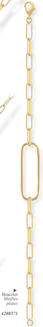
▶ Bracelet Mailles plates 4208571