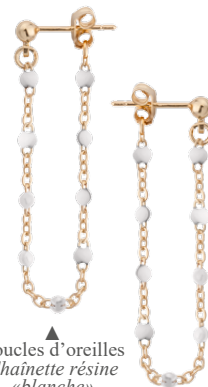
Boucles d'oreilles Chânette résine «blanche» 1208874BL