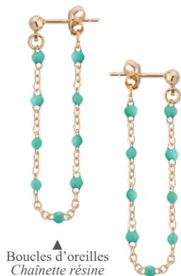
Boucles d'oreilles Chânette résine «turquoise» 1208874TU