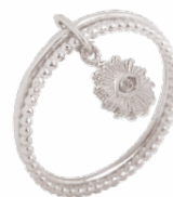
◀ Bague «œil solaire» zirconium 5908517