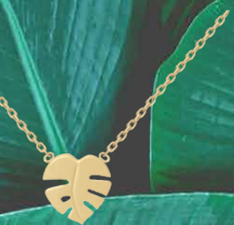
▲ Collier «Feuille de Monstera» 42 cm 3208499