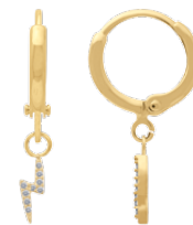
▲ Mini-créole pendant - zirconiums «Éclairs» 1208513