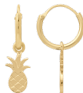
▶ Mini-créole pendante «ananas» 1208685-14MM