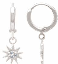
▲ Mini-créoles pendantes «soleils» zirconiums 1908509