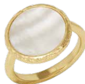
▲ Bague «nacre, cercle martelé» 5207638.MOP