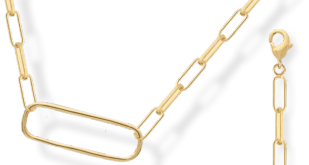
▲ Collier 43cm Mailles plates 3208571