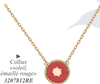
▲ Collier «soleil, émaillé rouge» 3207812RE