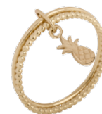
▶ Bague «ananas» 5207398