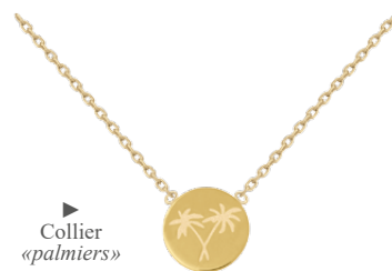
Collier «palmiers» 3207902