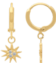
▲ Mini-créole pendante - zirconiums «Soleil» 1208509