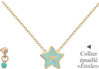
Collier émaillé «Étoiles» 3207379