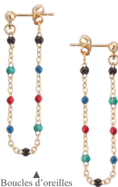
▲ Boucles d'oreilles Chainette résine «multicolore» 1208874MUL