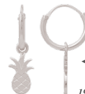
◀ Mini-creoles pampilles «ananas» 1908685-14MM