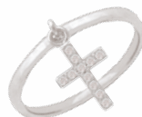
◀ Bague «Croix» zirconiums 5908511