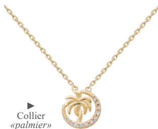
▶ Collier «palmier» 3208408