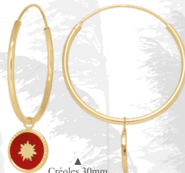
▲ Créoles 30mm pampilles «soleils, émaillés rouges» 1208056-30-RE